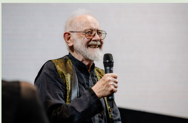
Kurt Schwertsik beim Festakt zu seinem 90. Geburtstag.